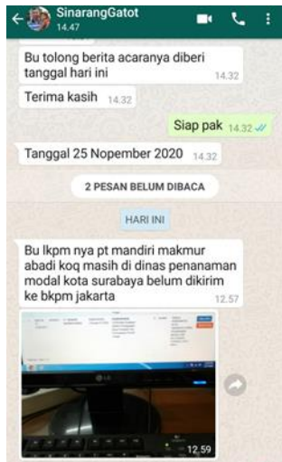
PT Mandiri Makmur Abadi