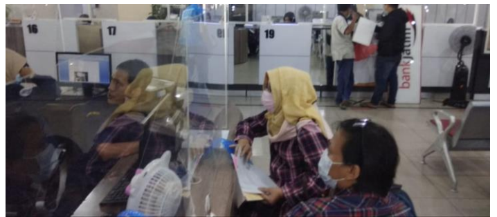
Pelayanan Loker HAKI

Jumlah Permohonan Perizinan Yang Masuk Sebanyak 84 Berkas