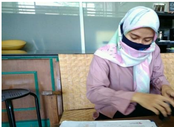
PT Nur Medica Farma Jl. Gunungsari Indah K-2