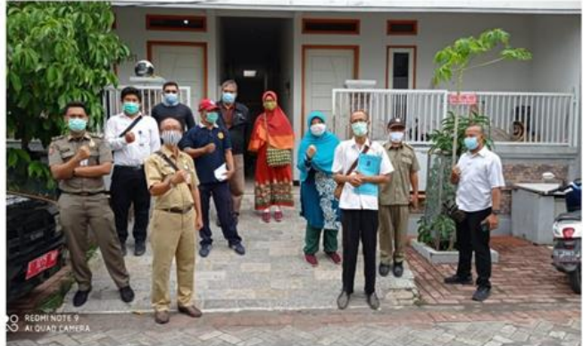
Kos Bu Sri Jalan Wonorejo Selatan I Kav 151