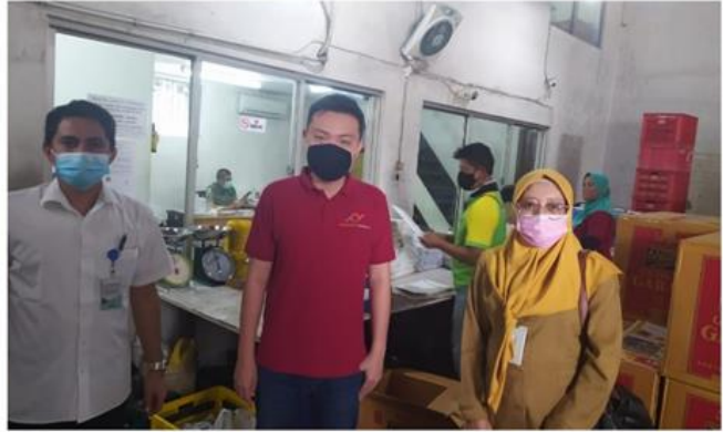
CV Perdana Printing Jl. Anjasmoro No. 2