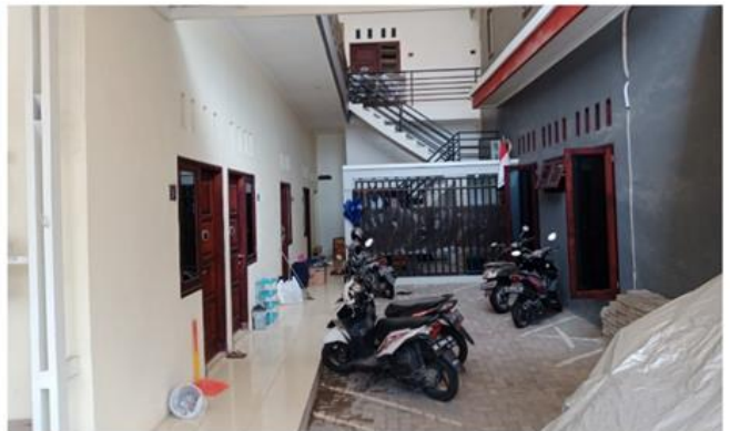
Jl. Keputih Tegal Bakti 1 No. 4