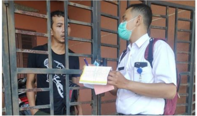
Jl. Marina Emas Timur II No. 2