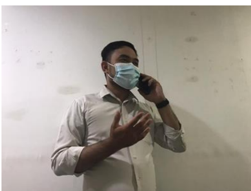
CV Berkat Anugerah Makmur