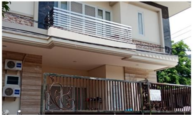
Jl. Marina Emas Timur II Blok C 45