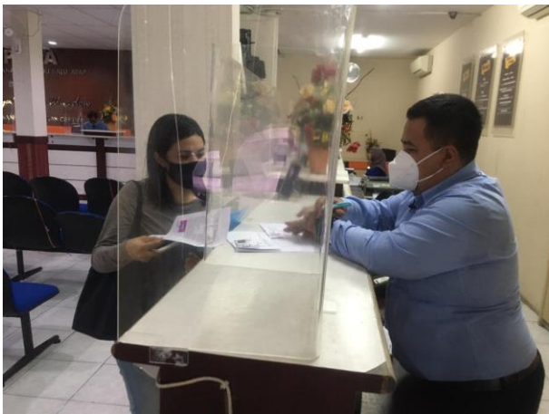
Pelayanan Konsultasi Dinas Kesehatan