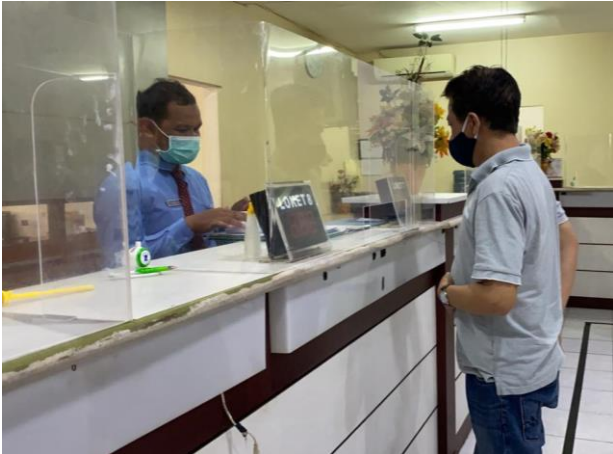
Pelayanan Loker Customer Service