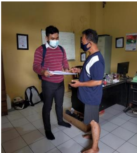
PT Atlantic Intraco (PMDN) Jl. Margomulyo 44 Blok Nn No. 5