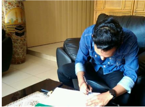
PT Tiga Putra Sentosa Jl. Gunungsari Indah Blok K No.35