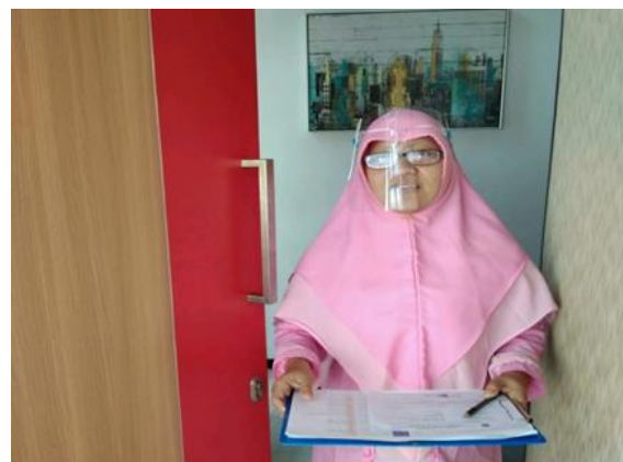
CV Cipta Karya Mandiri Jl. Ketintang Madya Cempaka No. 59