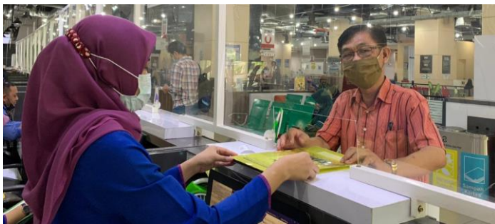
Pelayanan Loker Customer Services