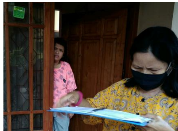
CV Artomoro Makmur Abadi Jl. Kebonsari 7A/14