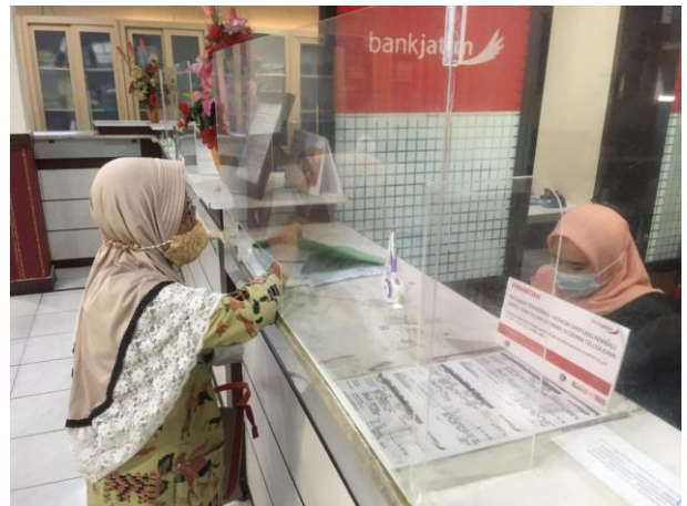
Pelayanan Loker Bank Jatim

Jumlah Permohonan Perizinan Yang Masuk Sebanyak 89 Berkas