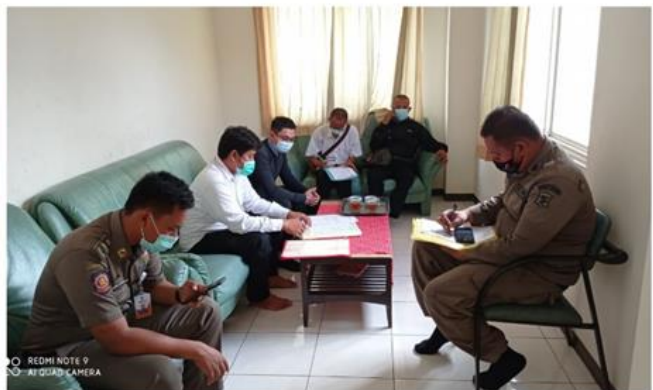
Widjaja Kos Jalan Tenggilis Mejoyo Ac No. 15