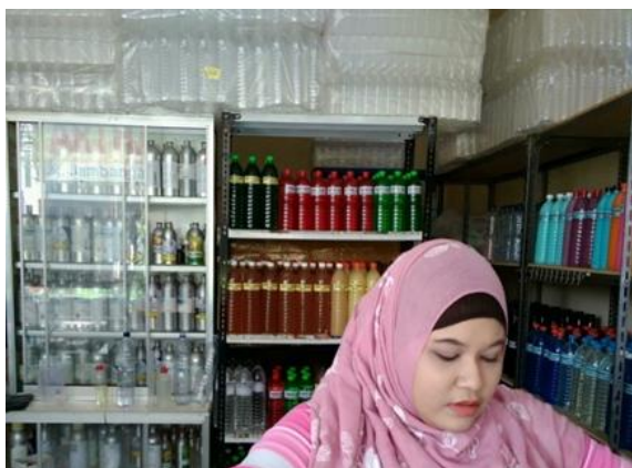
UD Artha Jaya Kimia Jl. Jambangan Kebonagung No. 55