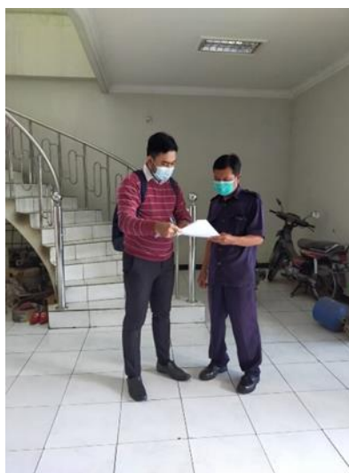
CV Kayu Kita (PMDN) Jl. Margomulyo 44 Blok C No. 8A

Jumlah Perusahaan yang Diberikan Pengawasan/Survey Sebanyak 3 Perusahaan