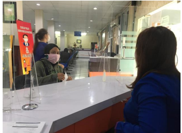
Pelayanan Loker Informasi