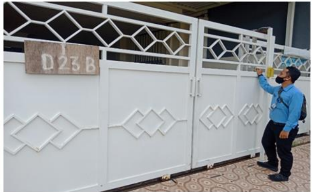
Jl. Marina Emas Timur I No. 18A