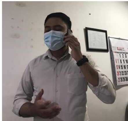
CV Bintang Cahaya Lestari

Jumlah Perusahaan yang Diberikan Asistensi Online Sebanyak 7 Perusahaan