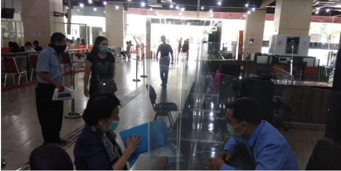
Pelayanan Loker Informasi