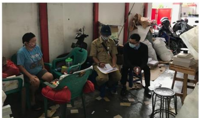
PO.Sinar Mas Jalan Mulyosari Mas Kav. 12-A