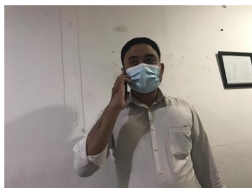
CV Anugerah Panen Lancar