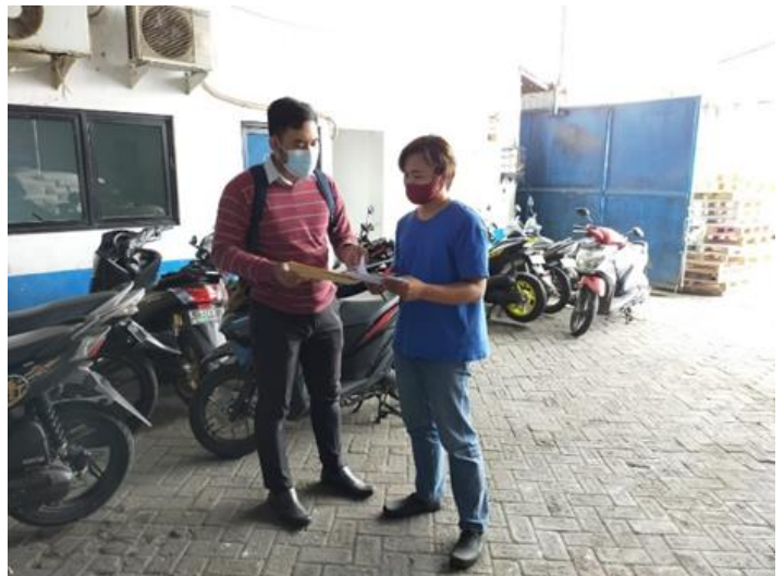
PT Tricipta Agung Sejahtera (PMDN) Jl. Margomulyo 44 Blok li No. 9