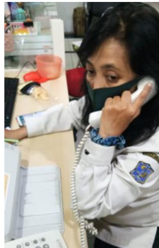
PT Maju Jaya Abadi