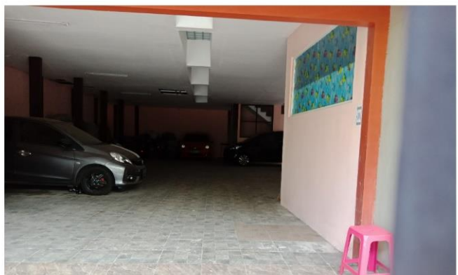
Jl. Marina Emas Timur I No. 45