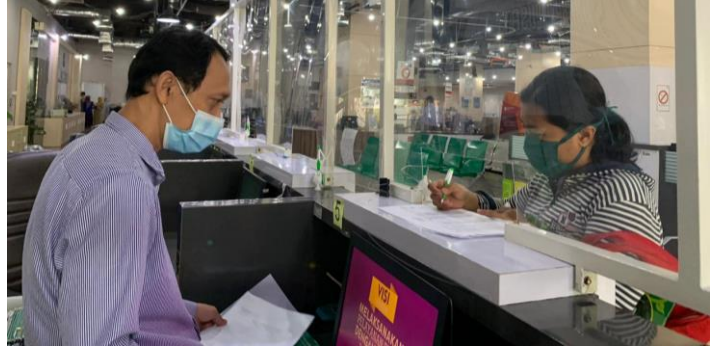
Pelayanan Loker Pengambilan