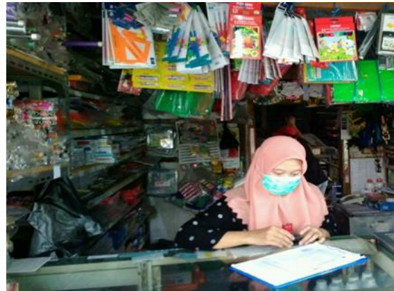
UD Mapan Jl. Karah 126